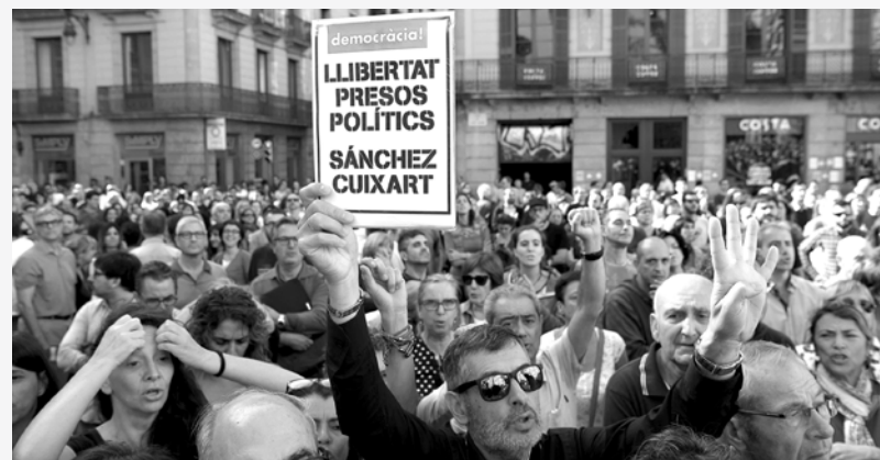
El sábado 21 marcharon 450.000 personas por la libertad de presos políticos independentistas

Lucha Internacionalista (LI), sección de la UIT-CI en Catalunya, ha venido participando en el proceso independentista, alertando sobre las limitaciones e inconsecuencias del gobierno catalán. "Con la suspensión de la proclamación de la República Catalana Puigdemont nos expone más a la represión [...] No confiamos en este gobierno: si ha llegado hasta aquí ha sido empujado por la gente en la calle [...] hay que profundizar la organización desde abajo, uniendo la izquierda sindical que convocó la huelga general del