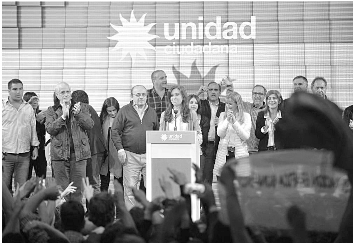
Cristina anunciando los resultados que no le fueron favorables de los comicios

La conclusión evidente de todo esto es que Cristina y el peronismo anti-K no son alternativa para frenar el ajuste y mucho menos salida política para los trabajadores.