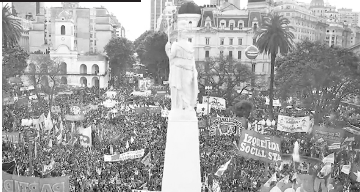
Marcha a Plaza de Mayo el 21 de octubre pidiendo justicia por Maldonado durante la veda electoral