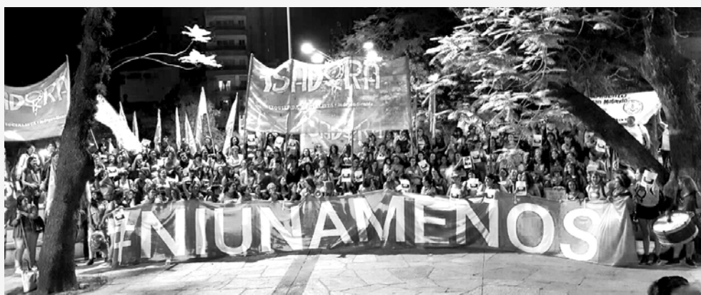
Numerosa marcha de Isadora en Chaco