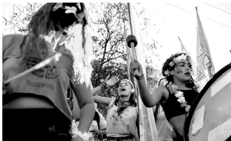
Masiva convocatoria al encuentro en la ciudad de Resistencia