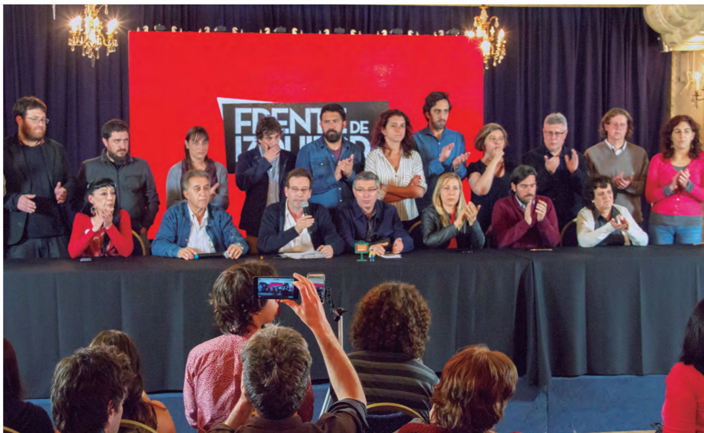
Conferencia de prensa en el hotel Castelar de los candidatos del FIT al conocerse los resultados

El FIT realizó además una extraordinaria elección en la provincia de Jujuy con un 18% a nivel provincial y un 25% en la capital, Mendoza se acercó al 12% y Salta llegando al 8%, lo que le permitió obtener varios legisladores provinciales y concejales. También se hicieron elecciones muy buenas en Santa Cruz (9,76%) y Neuquén (6%), donde por primera vez se ingresó al Concejo Deliberante de la capital.