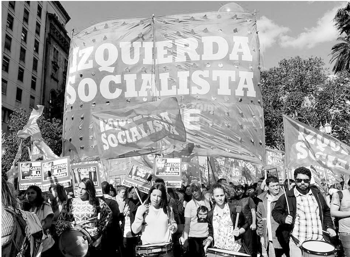
Columna de Izquierda Socialista reclamando por Santiago Maldonado